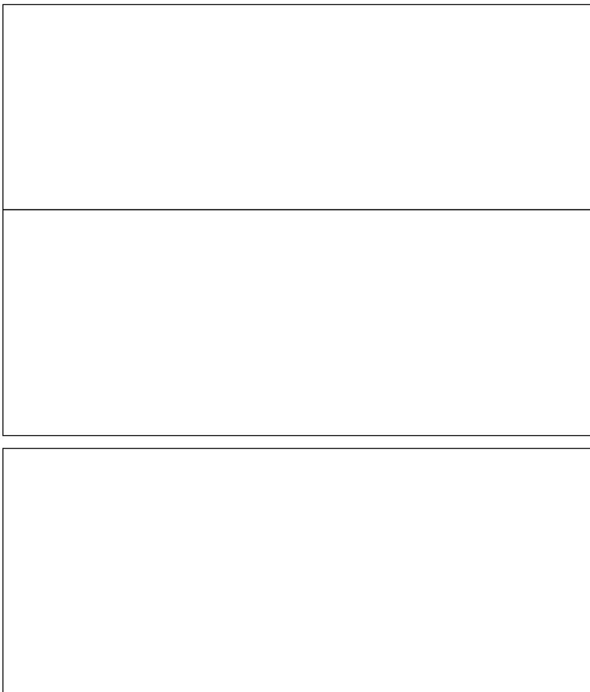
Схема размещения рекламной конструкции